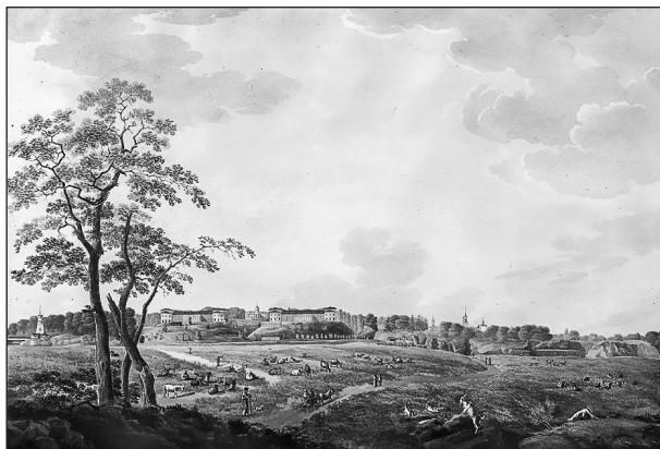
П.П. Свинын. Вид на Архангельское. 1824. Акварель.

Возможно, путь увядания нашел бы своих поэтов, но в непосредственном окружении князя Н.Б. Юсупова-младшего, унаследовавшего Архангельское в 1849 г., их не было, да и сама усадебная тема еще не была открыта как самостоятельная ценность. При этом князь и его супруга, Т.А. Юсупова, урожденная графиня Рибопьер, вновь превратили Архангельское в конце 1850-х — 1860-х гг. в живую обитаемую усадьбу, с гостями и торжественными мероприятиями, включая коронационные. 1870-е гг. ознаменовались новым застоем, продолжавшимся до начала 1880-х гг., когда фак-