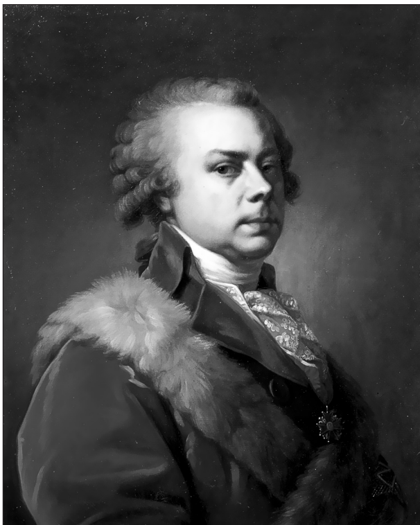
И.Б. Лампи-старший. Портрет князя Н.Б. Юсупова. 1790-е гг. Холст, масло.

Гос. Музей-усадьба «Архангельское» (далее — ГМУА) (1878) 2 . Эти произведения составили своего рода художественно-литературную часть канонического набора произведений, служивших с определенного времени постоянным источником цитат для научных и популярных текстов об Архангельском.