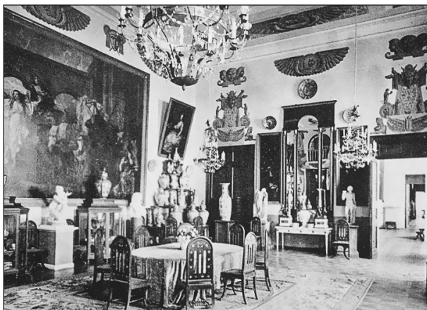
П.П. Павлов. Архангельское. Дворец. Парадная столовая (Египетский зал). Начало 1910-х. Фототипия на бланке открытого письма. ГМУА

ном использовании. Судьба Архангельского решалась не как результат компромисса между частными интересами хозяев и их представлениями о своем общественном долге и не как результат диалога между хозяевами и культурной общественностью, а как результат борьбы этой общественности и персонала усадьбы (впоследствии — сотрудников музея) за сохранение культурных ценностей, с одной стороны, и разных ведомств и групп населения за использование барской недвижимости, с другой. Штат музея до 1934 г. был небольшим, никогда не превышая вместе с охраной 16 человек, и сотрудники физически не могли использовать