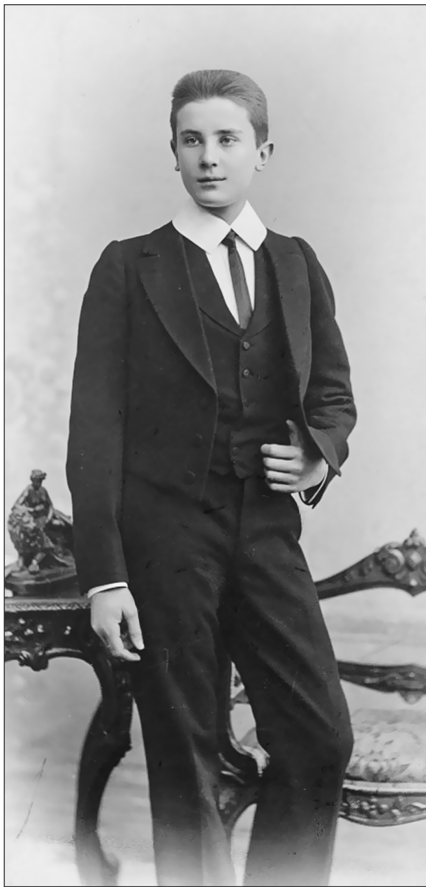
Ф. Буассон и Ф. Эгглер. Граф Феликс Сумароков-Эльстон-младший. Конец 1902 — начало 1903 г. Фотография. Отпечаток на коллодионовой бумаге. ГМУА

в системе категорий развивавшегося «усадебного мифа». С другой стороны, эти произведения способствовали упрочению репутации усадьбы как одной из важнейших в ближнем Подмосковье и неформальному возведению ее в ранг общественно значимого культурного и природного объекта.