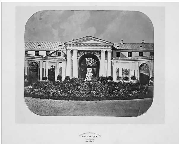
Э. Прикам. Парадные ворота, вид от дворца. Конец 1860-х. Фотография. Отпечаток на альбуминовой бумаге.

Резкое изменение в конце 1917 г. статуса помещичьих усадеб неизбежно поставило перед обществом и властью вопрос об их рациональ-