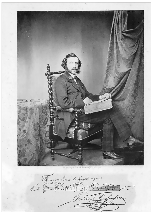
Ф.С. Ханфштенгл. Князь Николай Борисович Юсупов-младший. Ок. 1855 г. Фотография. Отпечаток на альбуминовой бумаге. ГМУА

но-парковых и архитектурно-природных ансамблей, ценность которого на рубеже веков была осознана уже в рамках быстро набирающего силу усадебного мифа [13, 14].